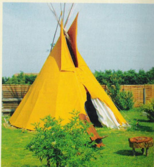
À Maigné, dans la Sarthe, on joue aux Indiens (et pas aux cow-boys) dans un tipi typique de la culture amérindienne.

On les laissera dans sa voiture le temps du séjour. Des activités et des spectacles sur mesure sont proposés aux entreprises. Comme rencontrer d'authentiques « Natives » ! ■